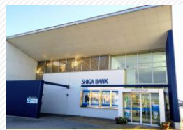
▲滋賀銀行安土支店