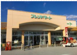
▲フレンドマート安土店