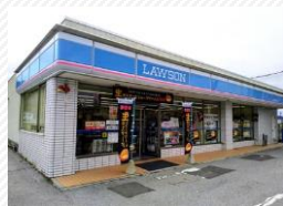
▲ローソン安土上豊浦店