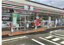
▲セブンイレブン五個荘清水鼻店