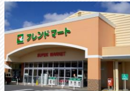
▲フレンドマート五個荘店