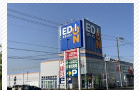
▲エディオン東近江店