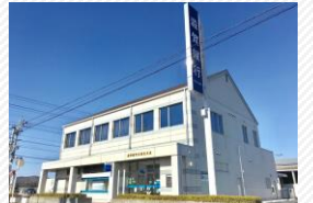
▲滋賀銀行五個荘支店