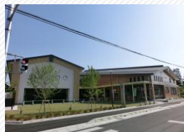
▲老蘇コミュニティセンター