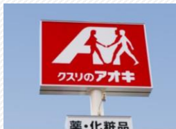
▲クスリのアオキ安土店