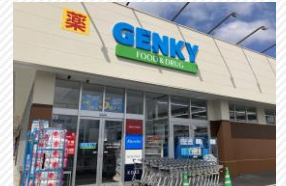
▲ドラッグストアGENKY五個荘店