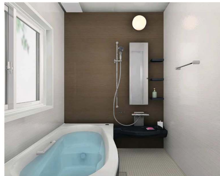
モクメUダーク(HT) 浴槽: ホワイト/床: ベージュ/収納: ブラック カウンター: ブラック/エプロン: ブラック