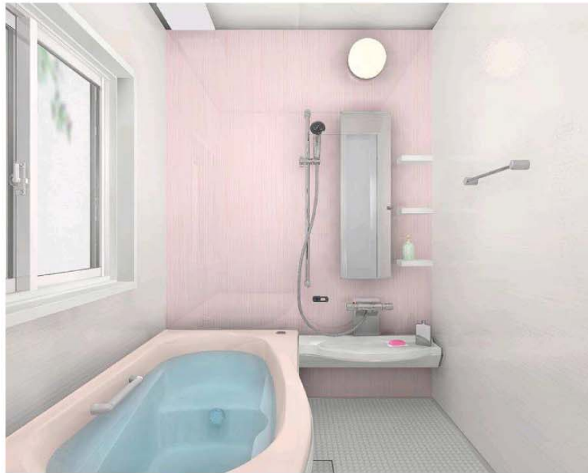
ピンクストライプ(鏡面) 浴槽: ピンク/床: グレー/収納: ホワイト カウンター: ホワイト/エプロン: ホワイト

③収納・カウンター・エプロンのカラーを選ぶ。 収納: ホワイト ブラック カウンター: ホワイト ブラック ブラウン エプロン: ホワイト ブラック