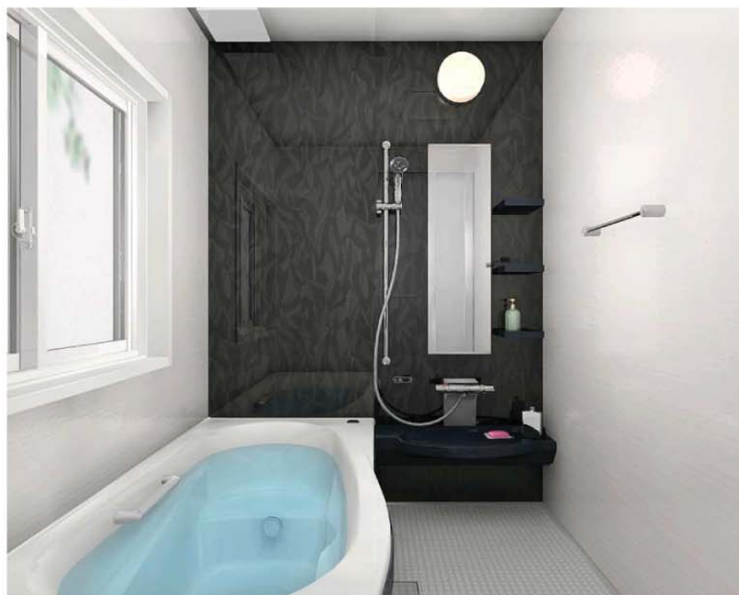
アラベスク(鏡面) 浴槽: ホワイト/床: グレー/収納: ブラック カウンター: ブラック/エプロン: ブラック