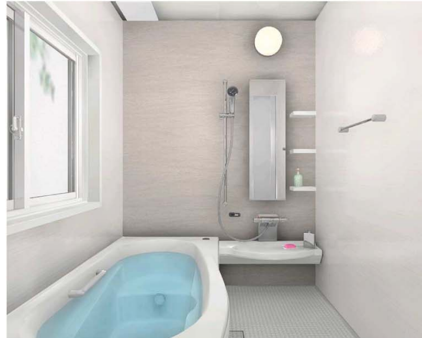
サンドストーングレー(HT) 浴槽: ホワイト/床: グレー/収納: ホワイト カウンター: ホワイト/エプロン: ホワイト