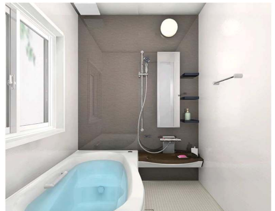
パサルディーナブラウン(鏡面) 浴槽: ホワイト/床: ベージュ/収納: ブラック カウンター: ブラウン/エプロン: ホワイト