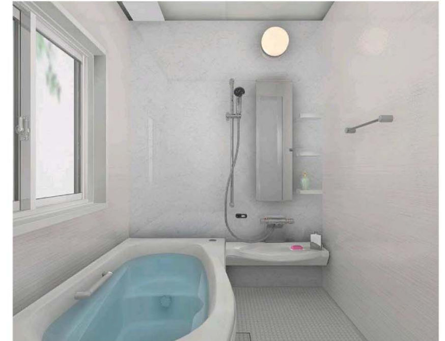
マーブルホワイト(鏡面) 浴槽: ホワイト/床: グレー/収納: ホワイト カウンター: ホワイト/エプロン: ホワイト